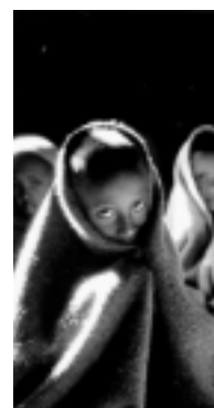
Fotografía: Sebastião Salgado

Es un mito o ingenuidad considerar que el principio de proximidad - que distingue al gobierno local frente a otros niveles de gobierno - garantiza de por sí el reconocimiento de la existencia de problemáticas de género, de necesidades específicas de las mujeres, ni la incorporación a la agenda municipal de políticas y acciones de equidad de género. La convicción que sostenemos de que el ámbito municipal es potencialmente el más adecuado y privilegiado, para construir y desarrollar políticas y acciones eficaces de igualdad de oportunidades entre los géneros, y para fomentar la ciudadanía real de las mujeres, no nos hace ignorar que es también el ámbito donde se presentan las resistencias más retrógradas y las hostilidades más directas contra los derechos y avances de las mujeres.